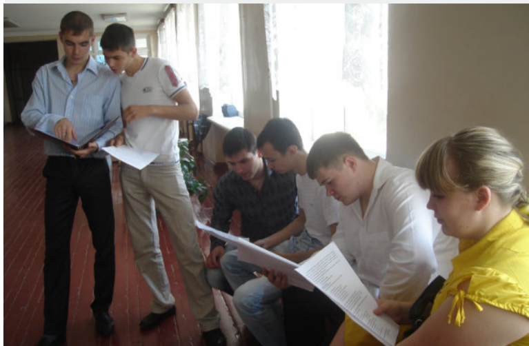
Государственные аттестационные комиссии (ГАК) Бендерского политехнического филиала ПГУ им. Т. Г. Шевченко, единственного высшего учебного заведения в г. Бендеры, оценили уровень подготовки выпускников филиала к выполнению профессиональных задач и соответствие подготовки требованиям Государственного образовательного стандарта.

Для выпускных групп высшего профессионального образования Государственная аттестация состояла из итогового междисциплинарного экзамена и защиты квалификационной работы, для среднего профессионального образования – из защиты дипломного проекта, а для обучающихся по программам начального профессионального образования – из итогового государственного экзамена по отдельной дисциплине и практической квалификационной работы по специальности.